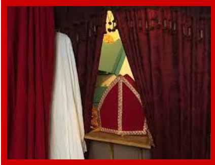
Sint hangt netjes zijn kleding op en De mijter staat op een tafeltje

Ondertussen heeft de Sint weer bij ons op school geslapen. Gelukkig dat hij zo al vast in de buurt van school kan zijn als we volgende week Sint' s verjaardag vieren.