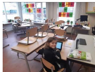
Groep 6 is er klaar voor!